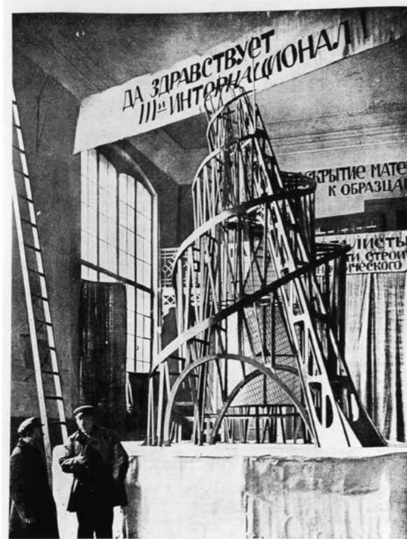
Den färdiga modellen. 1920. Tatlin (med pipa i handen) talar med en av sina vänner, en sönman. The finished model, 1920. Tatlin (with pipe in hand) talking to one of his friends, a sonman. Готовый модель наготовлена. 1920. (Татлин с трубкой в руке беседует со своим другом-сыном).

Kanttekening in een oud Grieks handschrift