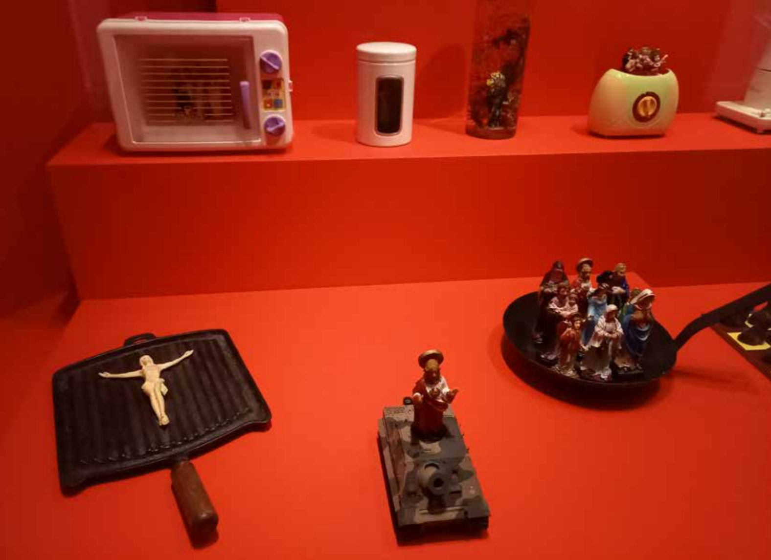
León Ferrari Ideeën voor de hel (fragment)

hun leven door geweevuur van vermoedelijke handlangers van de regering. Dit werk geeft de woelige en ordeloze periode weer tussen de militaire staatsgrepen van 1971 en 1980. Daarnaast reflecteert Karamustafa met aansprekende beelden op de man-vrouwverhoudingen in een veranderend Turkije. Sterke vrouwen zien we in de video The City and the Secret Panther Fashion . Deze video toont een groep vrouwen die, gekleed in sexy kleren met een panterprint en met make-up, in het geheim bij elkaar komen. Alleen in het verborgene kunnen ze zich op deze manier transformeren, want het is in Turkije verboden om dusdanig uitgedost in de openbaarheid te verschijnen. Het zijn dappere vrouwen die de verboden trotseren en de spanningen die dit oproept, worden door Karamustafa knap opgeroepen. In een interview met Vasif Kortun (Istanboel 1958, curator, schrijver en docent) legt ze uit waarom ze in haar werk vaak naar het panterpatroon verwijst. Het is voor haar een 'symbool van vrijheid en flamboyantie': de vrouwen in de video willen even ontsnappen aan hun saaie leven en dat lukt beter in panterprint kleding.