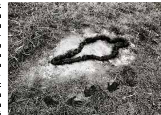
Ana Mendieta Siluetas Series 3

Vooraf bij etnische en culturele minderheden in de jaren zeventig ziet men dat het accent in de kunst naar de inhoud verschuift. Musea zijn voor hen vooral een platform voor politieke en maatschappelijke debatten. Hun werk had voor hen een universele betekenis die zich verder uitstrekte dan hun eigen culturele achtergrond. Feministisch georiënteerde kunstenaars maakten een bewuste keuze. Hun invloed op de kunstwereld in de Verenigde Staten was enorm in het begin van de jaren zeventig en was een van de belangrijkste vernieuwende krachten binnen de hedendaagse kunst. Zij veroorzaakten een doorbraak in het idee dat vrouwelijke kunst niet evenwaardig is aan die van de man. Nieuwe ideeën creëerden ook andere vormen van kunst. Het schilderen was voor velen een gepasseerd station en nieuwe media zoals video, environments en performance pasten meer in hun belevingswereld. Behalve het gebruik van nieuwe materialen en media hadden zij grote invloed op de intellectuele structuren van de kunstwereld. Zij waren niet geïnteresseerd in esthetische aspecten, maar stelden de maatschappelijke positie van vrouwen voorop. Hun kunstwerk was een 'betekenisdrager' en volgens de ideeën van de Franse filosoof Jacques Derrida moest men niet de esthetische effecten maar het maatschappelijk effect laten prevaleren.