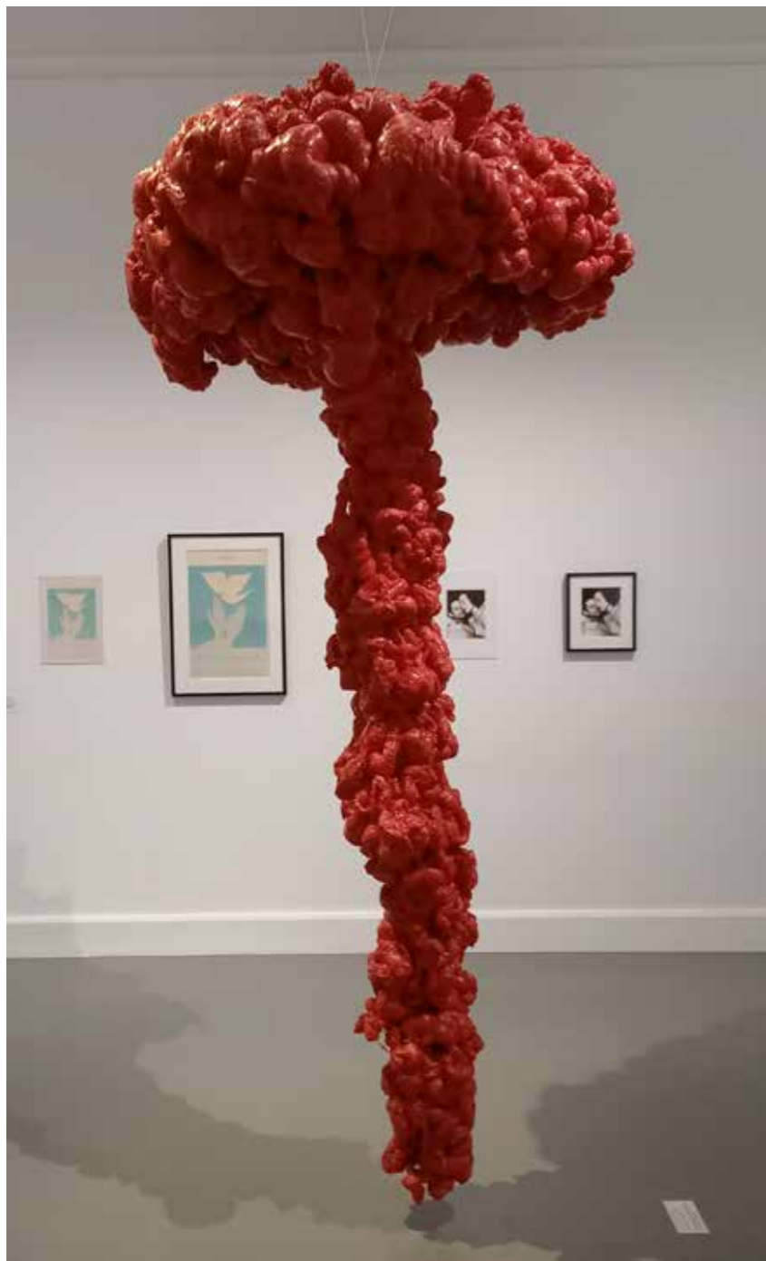
León Ferrari Hongo nucleaire

geproduceerd door nucleaire explosies. Ook nu nog is dit dreigende beeld relevant als het er om gaat hoe sommige landen hun macht willen overbrengen.