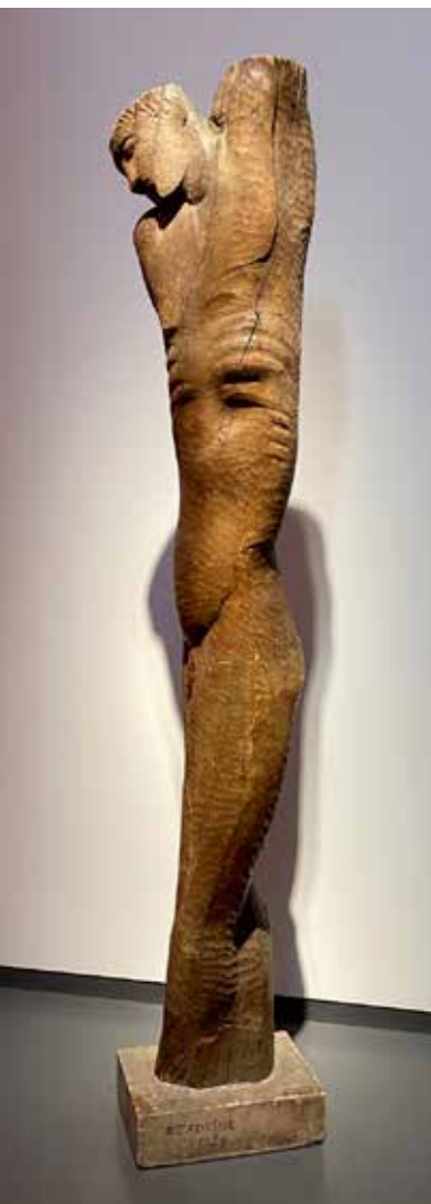
Ossip Zadkine Saint Sébastien Collectie Van Abbemuseum

Zadkine staat naast zijn houten beelden ook bekend om zijn grote figuratieve bronzen. Het beroemdste voorbeeld is ongetwijfeld: De verwoeste stad , het oorlogsmonument dat Zadkine voor Rotterdam maakte. Het zes en een halve meter hoge bronzen beeld geldt als sculpturale tegenhanger van Picasso's schilderij Guernica . Het beeld is een menselijke gedaante en