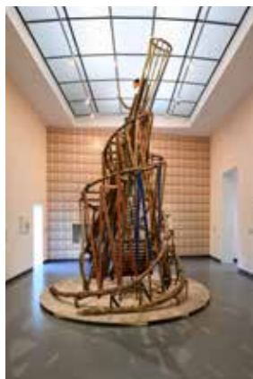
White man got no dreaming , 2008 Collectie Van Abbemuseum

Na enige tegenslag - verkeersinfarct in de verre omtrek - een dag later toch de Lichtstad bereikt met als bestemming het Van Abbemuseum. Wat is Eindhoven toch een leuke en bruisende stad geworden, vergeleken met de zwart-wit herinneringen van 30 jaar geleden! Bij het museum staan alle deuren al open: het is Dutch Design Week en ik voeg me in de stroom kunstliefhebbers. Bij de oudbouw van het museum staat echter een kordate dame die me terugwijst: zonder een polsbandje met het juiste design kom ik daar niet in. Maar ze vertrouwt me toe dat ik eigenlijk weinig mis... Dat hoor ik graag en dus snel door naar de collectietentoonstelling Dwarsverbanden . Hier is het zoeken naar pareltjes en verrassingen. Dit pareltje tref ik aan in een mooi gestileerde zaal met in het midden een houten, omhoog draaiende toren van Babel. De perspectieflijnen keren hierbij terug in het glazen plafond en de schaduwen op de vloer geven een uitvergroting in het platte vlak. Een krachtig werk dat alleen op de juiste manier tot zijn recht komt. ●