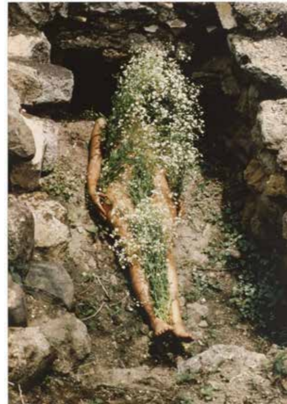
Ana Mendieta Siluetas Series 2

tief gedragen, menselijk erfgoed. De verschillende lagen van individuele en sociale geschiedenis wilde zij ontdekken en de daardoorheen sluimerende etnische, culturele en maatschappelijke gendervooroordelen om daarmee het zelfbewustzijn en begrip van de complexiteit van de samenleving te bevorderen. 'Ik voer een dialoog tussen het landschap en het vrouwelijk lichaam, gebaseerd op mijn eigen silhouet. Ik geloof dat dit een direct gevolg is van het feit dat ik tijdens mijn adolescentie van mijn thuisland Cuba ben verscheurd. Ik word overweldigd door het gevoel uit de baarmoeder (natuur) te zijn geworpen. Mijn kunst is de manier waarop ik de banden herstel die mij met het universum verbinden. Het is een terugkeer naar de moederlijke bron. Door mijn aardelichaam sculpturen word ik één met de aarde. Ik word een verlengstuk van de natuur en de natuur wordt een verlengstuk van mijn lichaam. Deze obsessieve daad van het opnieuw bevestigen van mijn banden