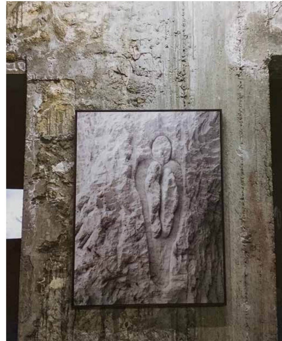
Ana Mendieta Atabey (Esculturas Rupestres) [Mother of the Waters (rupestrian Sculptures)] Collectie Van Abbemuseum