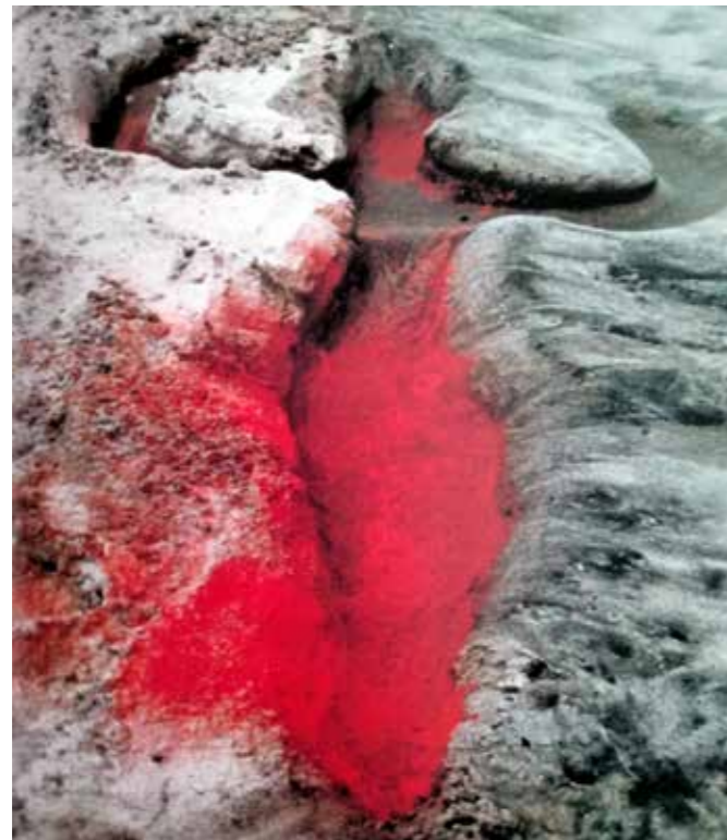
Ana Mendieta Siluetas Series 1

Al tijdens haar studie maakte zij kennis met vroege op performance gebaseerde werken en zocht zij voorzichtig haar weg in de conceptuele en lichaamsgerichte praktijk van de jaren zestig en zeventig. Sculpturen van haar uit de jaren tachtig bestaan dan uit fragiele materialen van aarde. De kunst van Ana Mendieta vindt duidelijk zijn oorsprong in de natuur en het lichaam. Samen met haar gemengde afkomst oefende dat grote invloed op haar identiteit en vrouwelijkheid. Haar aarde-lichaamswerken die we zien in de Siluetas Series (silhouettenreeks), waarbij zij haar eigen lichaam als sjabloon gebruikt, laten een samensmelting zien van conceptualisme, proces, performance, lichaam, feminisme en landschapskunst. 'Ik heb mezelf in de elementen gestort die mij hebben voortgebracht, waarbij ik de aarde als mijn canvas en mijn ziel als mijn gereedschap heb gebruikt.' De 'Siluetas' waren voor haar een terugkeer naar een metaforische baarmoeder en haar geboorteland Cuba. Zij wilde hiermee hartstochtelijk graag een verbinding leggen met een breder collec-