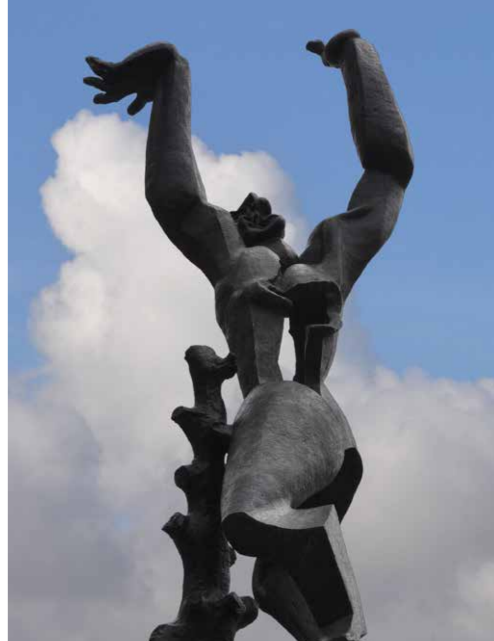
Ossip Zadkine De verwoeste stad

belichaamt de stad in het uur van haar verwoesting. Haar doorboorde lichaam is een grote wond- een symbool van het vernietigde hart van de stad. De mond opent zich in een kreet van angst en pijn. Als in een wanhopig afwerende klacht worden de armen ten hemel geheven.