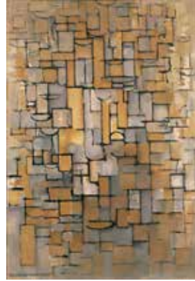
Piet Mondriaan, Compositie XIV , 1913 Collectie Van Abbemuseum

Bij Compositie XIV (1913) van Piet Mondriaan en De Zaaier van Constant Permeke (1935) voel ik een speciale onderlinge verbondenheid: eenzelfde kleur, een achter stijl en richting verborgen verband in uitdrukking. Ik heb geen eruditie in kunst en ik kies op interesse, intuïtief. Het gaat daarbij ook om kleur en uitdrukking, een eigen accent, en minder om een kunststroming.